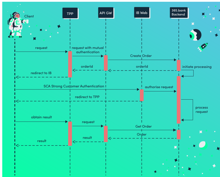
Obrázok č. 1 – Orchestrácia volaní, scenáre AI, POI, LOT